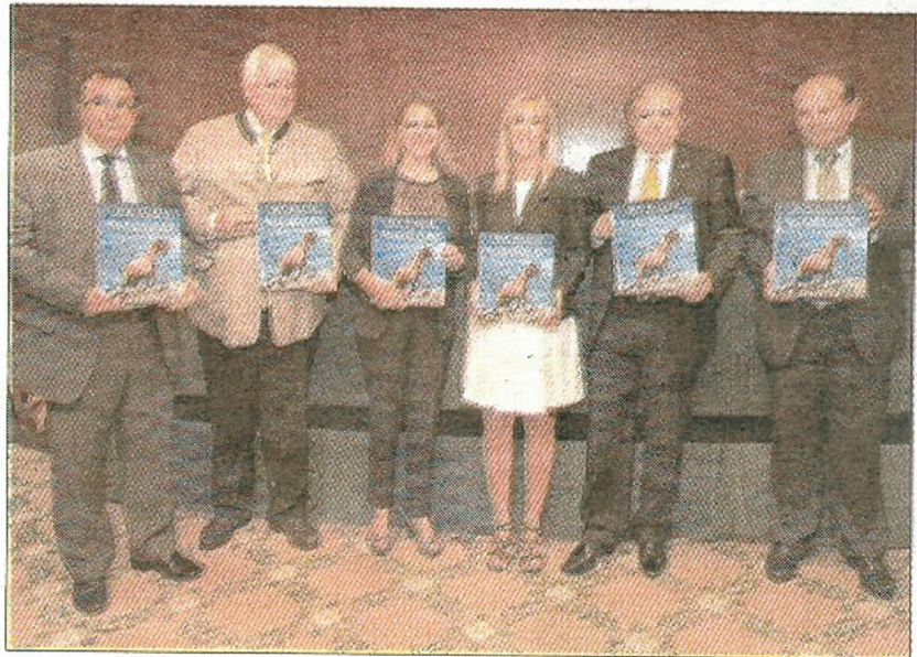
Alguns assistents a la presentació, amb el llibre a les seves mans. F.V.V.

El llibre és un recull acurat de treballs científics sobre aquesta raça i engloba aspectes i vessants heterogènies relacionades amb la pràctica cinètica. Es tracta d'una publicació que té entre els seus objectius ser una eina de divulgació i informació sobre la