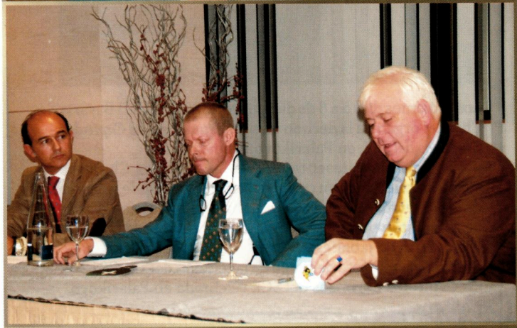
Mesa presidencial en el momento de las intervenciones