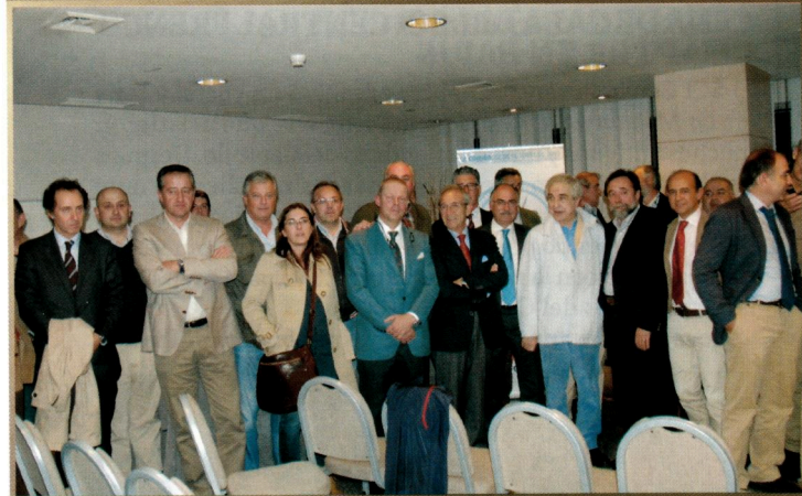
Algunos de los asistentes posando para la 'foto de familia', en este caso, imagen del momento de la constitución del Chapter.