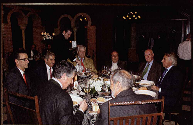
Una mesa presidencial digna de los premios y los premiados.